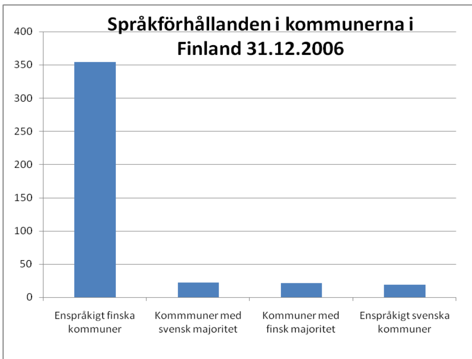
Figur 1. Språkförhållanden i kommunerna i Finland (uppgifterna från Statistisk årsbok för Finland 2007).