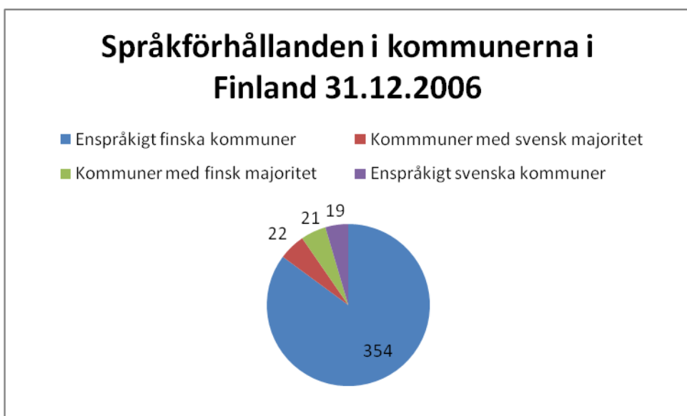
Figur 2. Språkförhållanden i kommunerna i Finland (uppgifterna från Statistisk årsbok för Finland 2007).